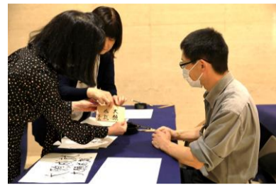
盛岡会場の体験(令和6年10月)