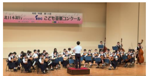
久慈市立久慈中学校マンドリン部