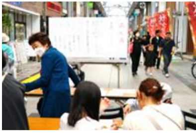
盛岡会場の体験(令和5年9月)