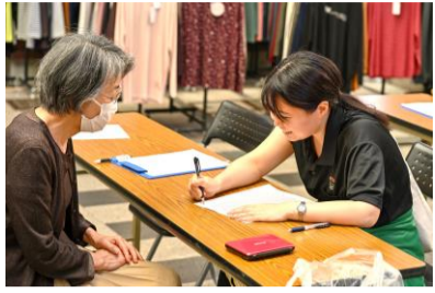
盛岡会場の体験(令和6年9月)