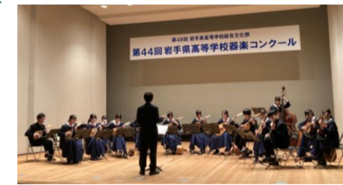
岩手県立久慈高等学校マンドリン部

久慈中学校、久慈高等学校、久慈マンドリーノの約60人の合同のマンドリン演奏。久慈市にマンドリンの調べが流れてから、もうすぐ70年を迎えます。令和8年に60回目の開催を数える演奏会「マンドリン音楽の夕べ」でも、久慈中学校、久慈高等学校、久慈マンドリーノの合同演奏を行うなど、家族や世代を超えての演奏を楽しんでおり、その伝統は脈々と受け継がれています。