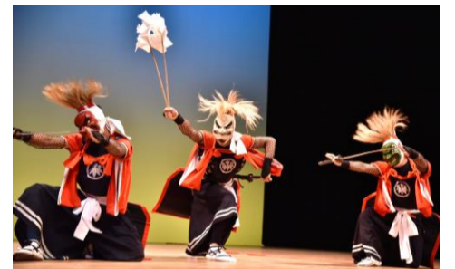
二子鬼剣舞保存会