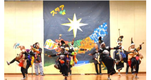
普代村立普代中学校