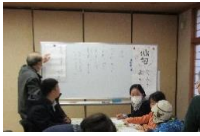
花巻会場の体験(令和6年1月)