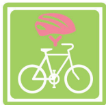
自転車ヘルメット かぶりましょう!