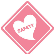
譲り合いの心 もちましよう♡